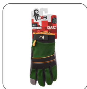
blister blister blister