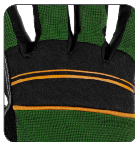
neopren v oblasti kloubů neoprene on knuckles neopren na stawach