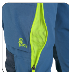
ventilace na stehně thigh ventilation wentylacja na nogawce