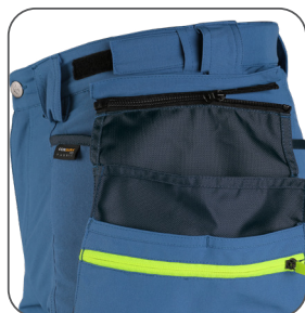
odepínací kapsy detachable pockets odpinane kieszenie