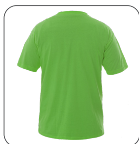
zadní strana back side z tyłu