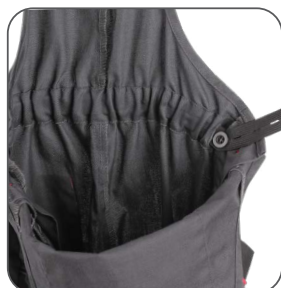
guma s knoflíkem pro přizpůsobení velikosti rubber with button for size adjustment guma z guzikiem do dostosowania rozmiaru