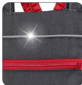
reflexní doplňky reflective accessories elementy odblaskowe