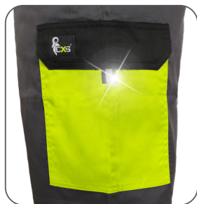
boční kapsa s klopou side flap pocket kieszeń boczna z patką