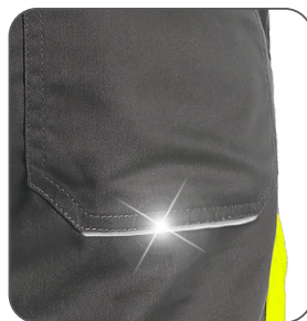
reflexní doplňky reflective accessories elementy odblaskowe