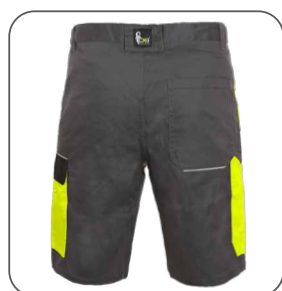
zadní strana back side z tyłu