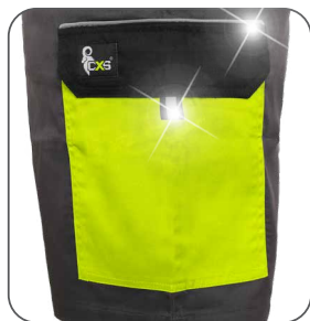
boční kapsa s klopou side flap pocket kieszeń boczna z patką