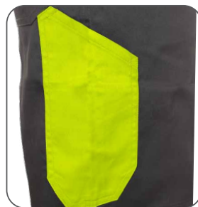
kapsa na skládací/svinovací metr tape/folding measure pocket kieszeń metr taśmowy / składany