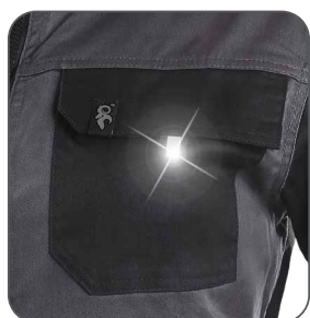
náprsní kapsa s klopou chest flap pocket kieszeń na piersi z patką