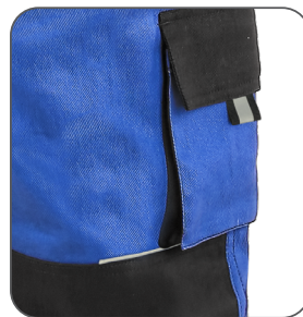
reflexní doplňky reflexné doplnky reflective accessories elementy odbłaskowe