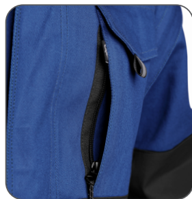
skrytá náprsní kapsa skryté náprsné vrecko hidden chest pocket ukryta kieszeń na piersi