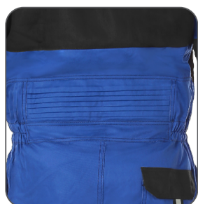
pruženka v bederní části elastická část chrbta lower back elastic part elastyczna wstawka w okolicy lędźwiowej