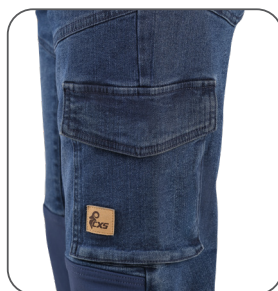
boční kapsa s klopou bočné vrecko s príklopkou side flap pocket boczna kieszeń z klapą