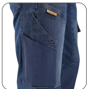
boční kapsa s CORDURA® materiálem bočné vrecko s materiálom CORDURA® side pocket with CORDURA® boczna kieszeń z materiału CORDURA®