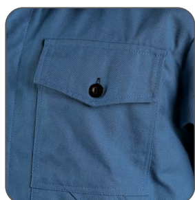
náprsní kapsa chest pocket kieszeń na piersi