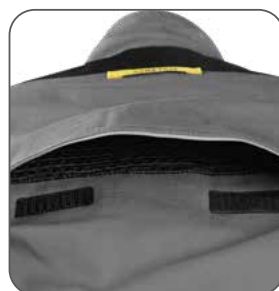
ventilace na zádech vetranie na zadnej strane ventilation on the back wentylacja z tyłu