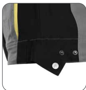
regulace v pase regulácia v páse adjustable waist regulowany pas