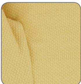
aramidová tkanina aramid cloth włóknina aramidowa